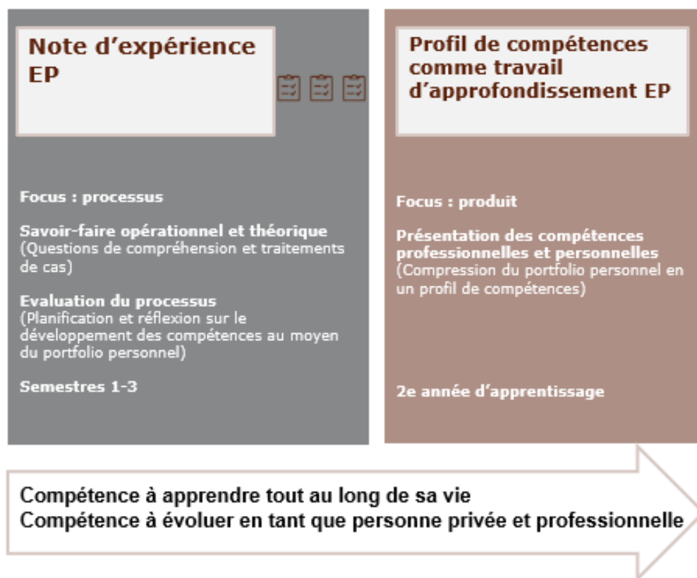
Schéma 3 : Procédure de qualification Culture générale – éléments et contenus

Ces deux éléments sont expliqués en détail dans les chapitres suivants.